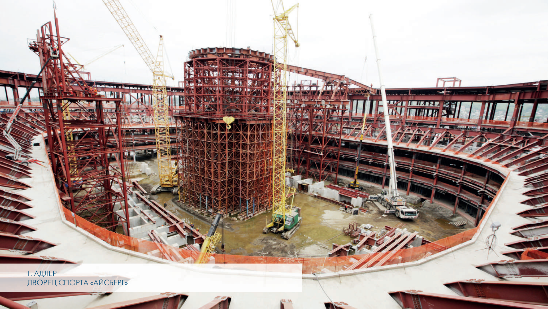
Г. АДЛЕР ДВОРЕЦ СПОРТА «АЙСБЕРГ»