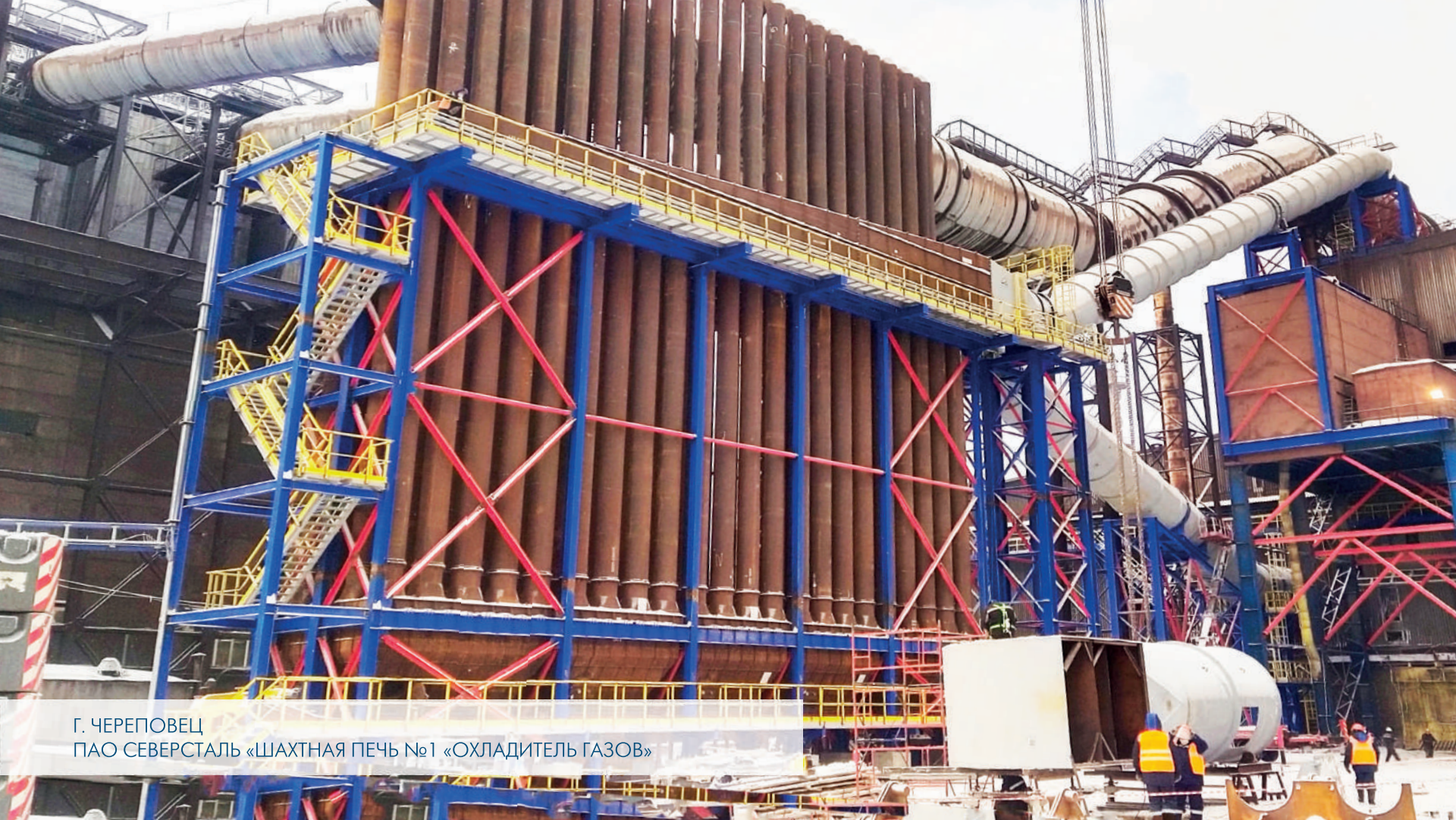
Г. ЧЕРЕПОВЕЦ ПАО СЕВЕРСТАЛЬ «ШАХТНАЯ ПЕЧЬ №1 «ОХЛАДИТЕЛЬ ГАЗОВ»