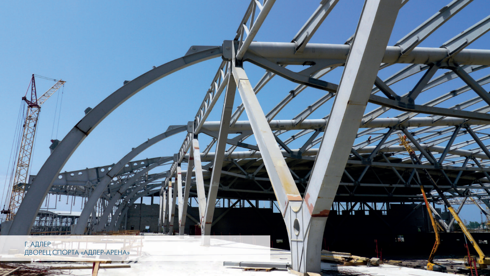
Г. АДЛЕР ДВОРЕЦ СПОРТА «АДЛЕР-АРЕНА»