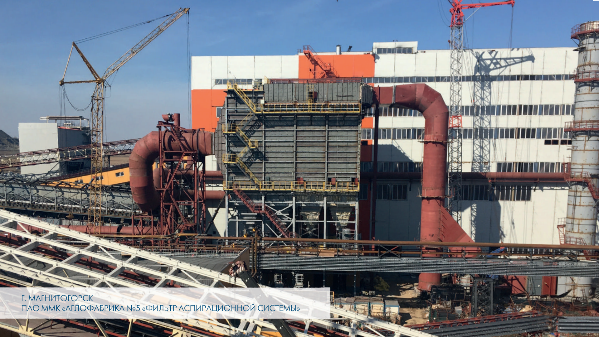
Г. МАГНИТОГОРСК ПАО ММК «АГЛОФАБРИКА №5 «ФИЛЬТР АСПИРАЦИОННОЙ СИСТЕМЫ»