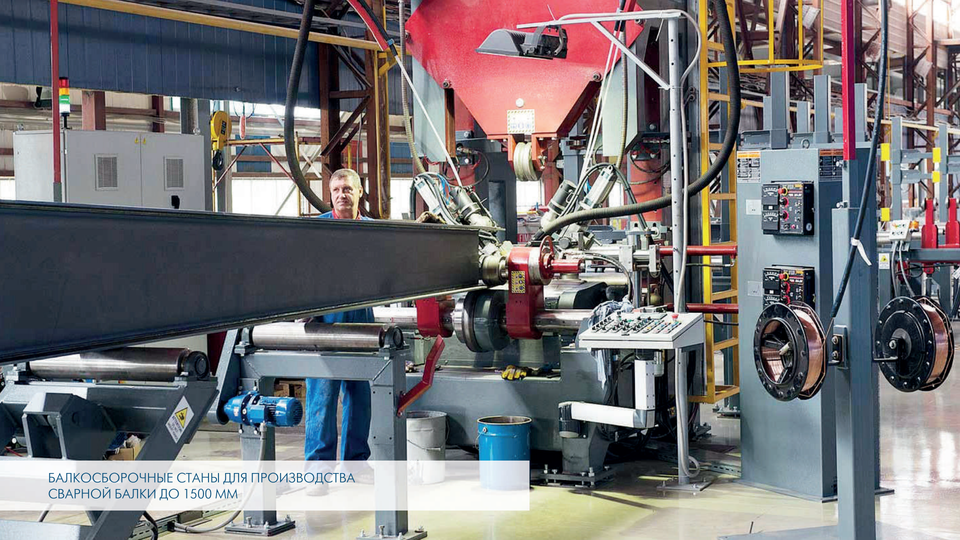
БАЛКОСБОРОЧНЫЕ СТАНЫ ДЛЯ ПРОИЗВОДСТВА СВАРНОЙ БАЛКИ ДО 1500 ММ