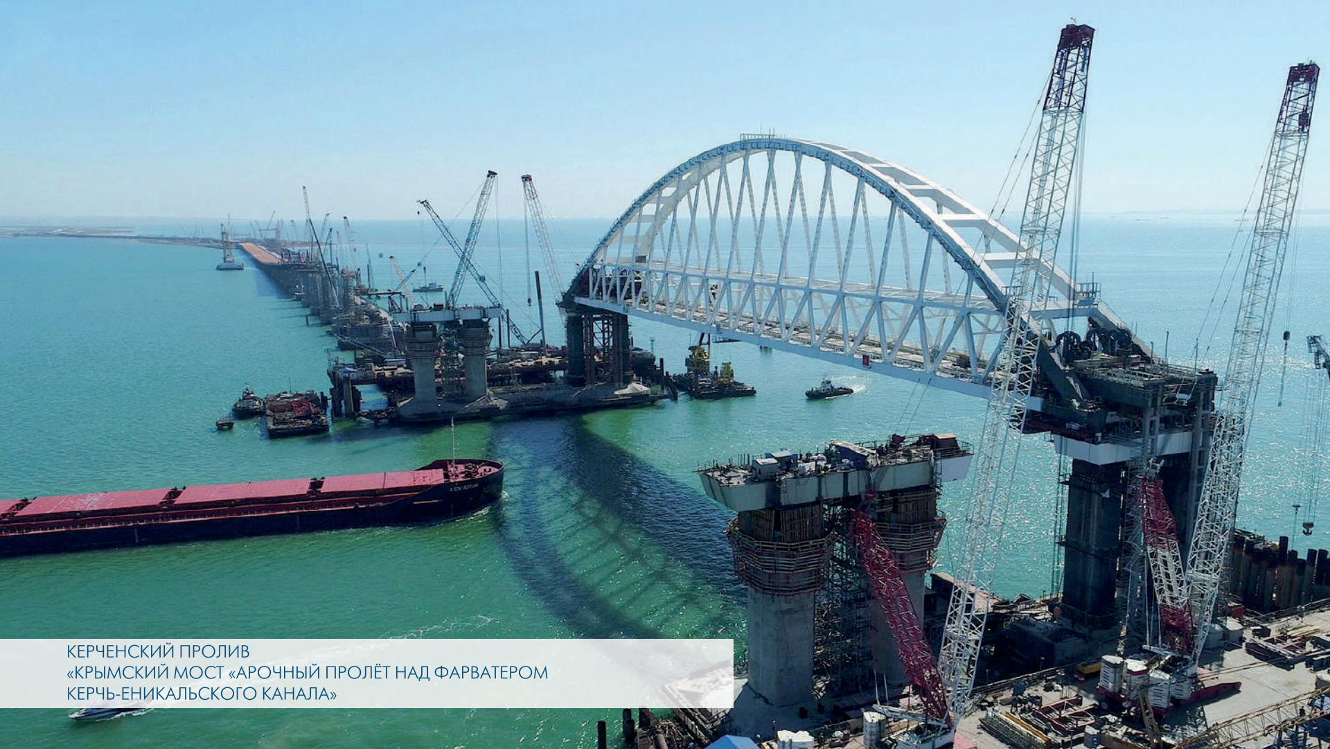
КЕРЧЕНСКИЙ ПРОЛИВ «КРЫМСКИЙ МОСТ «АРОЧНЫЙ ПРОЛЁТ НАД ФАРВАТЕРОМ КЕРЧЬ-ЕНИКАЛЬСКОГО КАНАЛА»