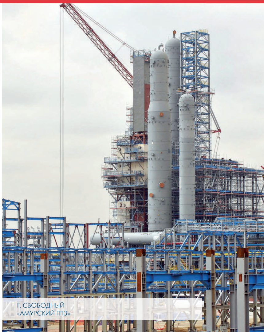
Г. СВОБОДНЫЙ «АМУРСКИЙ ГПЗ»