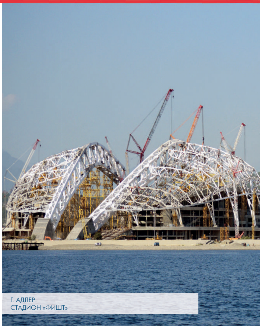
Г. АДЛЕР СТАДИОН «ФИШТ»

ПО «СПЕЦСТРОЙ» является лидером в области реализации строительных проектов.