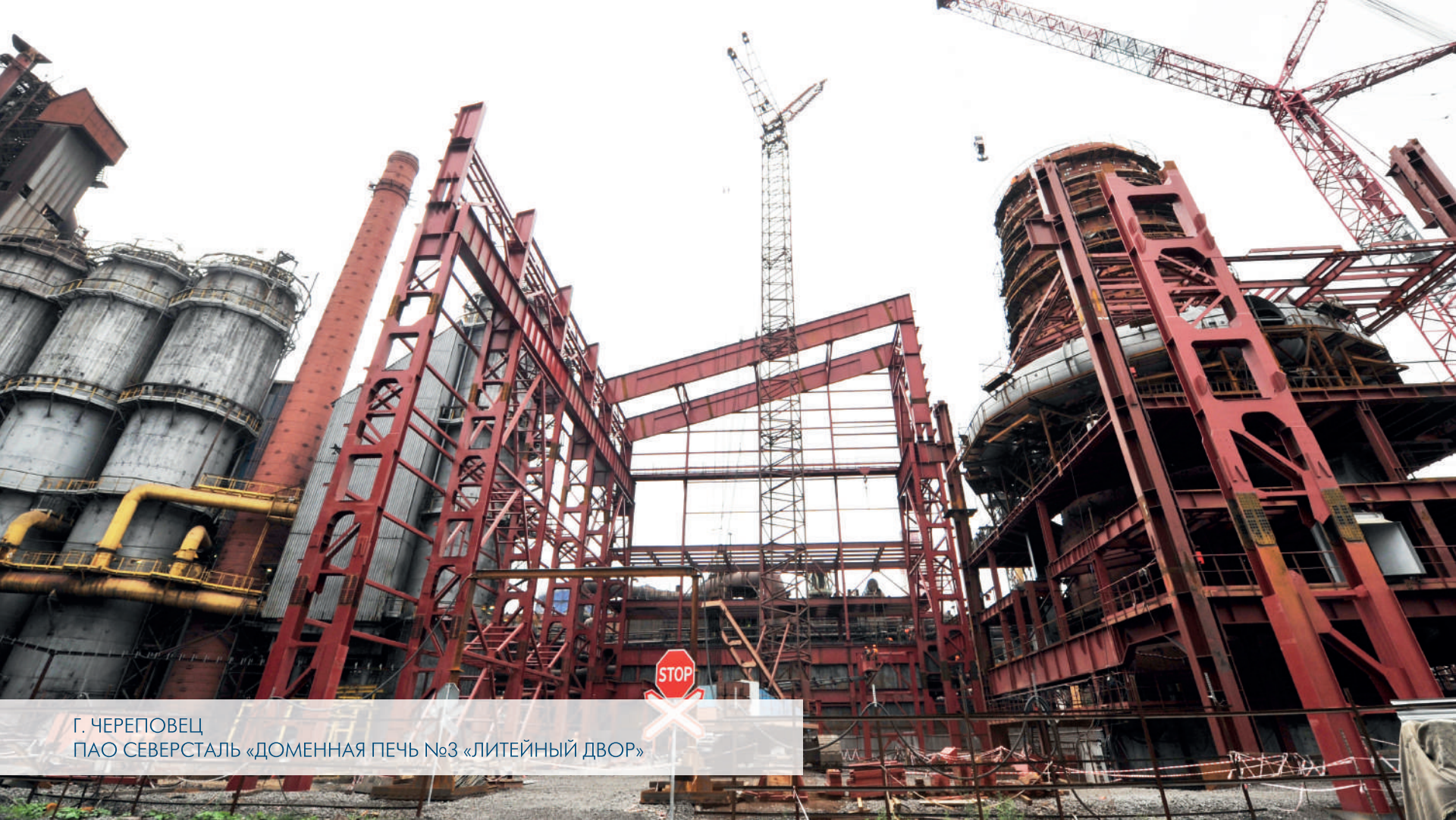
Г. ЧЕРЕПОВЕЦ ПАО СЕВЕРСТАЛЬ «ДОМЕННАЯ ПЕЧЬ №3 «ЛИТЕЙНЫЙ ДВОР»