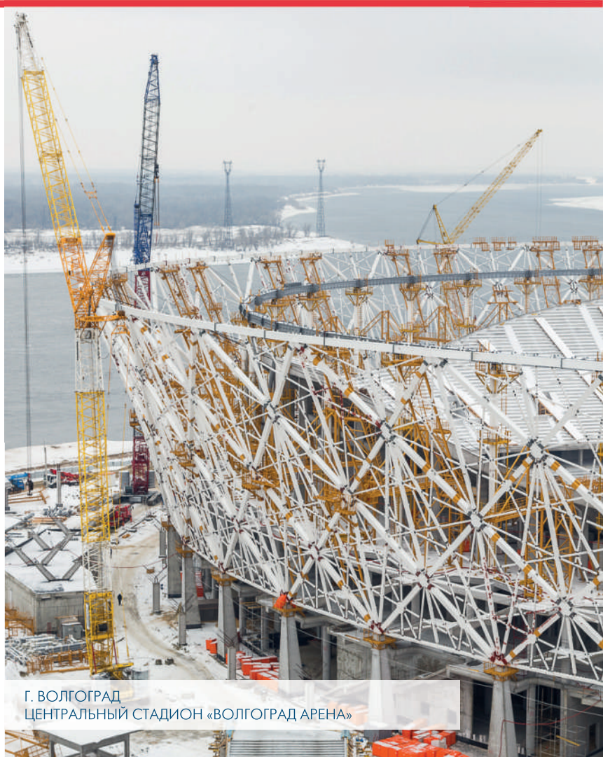
Г. ВОЛГОГРАД ЦЕНТРАЛЬНЫЙ СТАДИОН «ВОЛГОГРАД АРЕНА»

ПО «СПЕЦСТРОЙ» ОКАЗЫВАЕТ ПОЛНЫЙ КОМПЛЕКС УСЛУГ ПО ПРОМЫШЛЕННОМУ И ГРАЖДАНСКОМУ СТРОИТЕЛЬСТВУ , ВКЛЮЧАЯ ФУНКЦИИ ГЕНЕРАЛЬНОГО ПОДРЯДЧИКА.