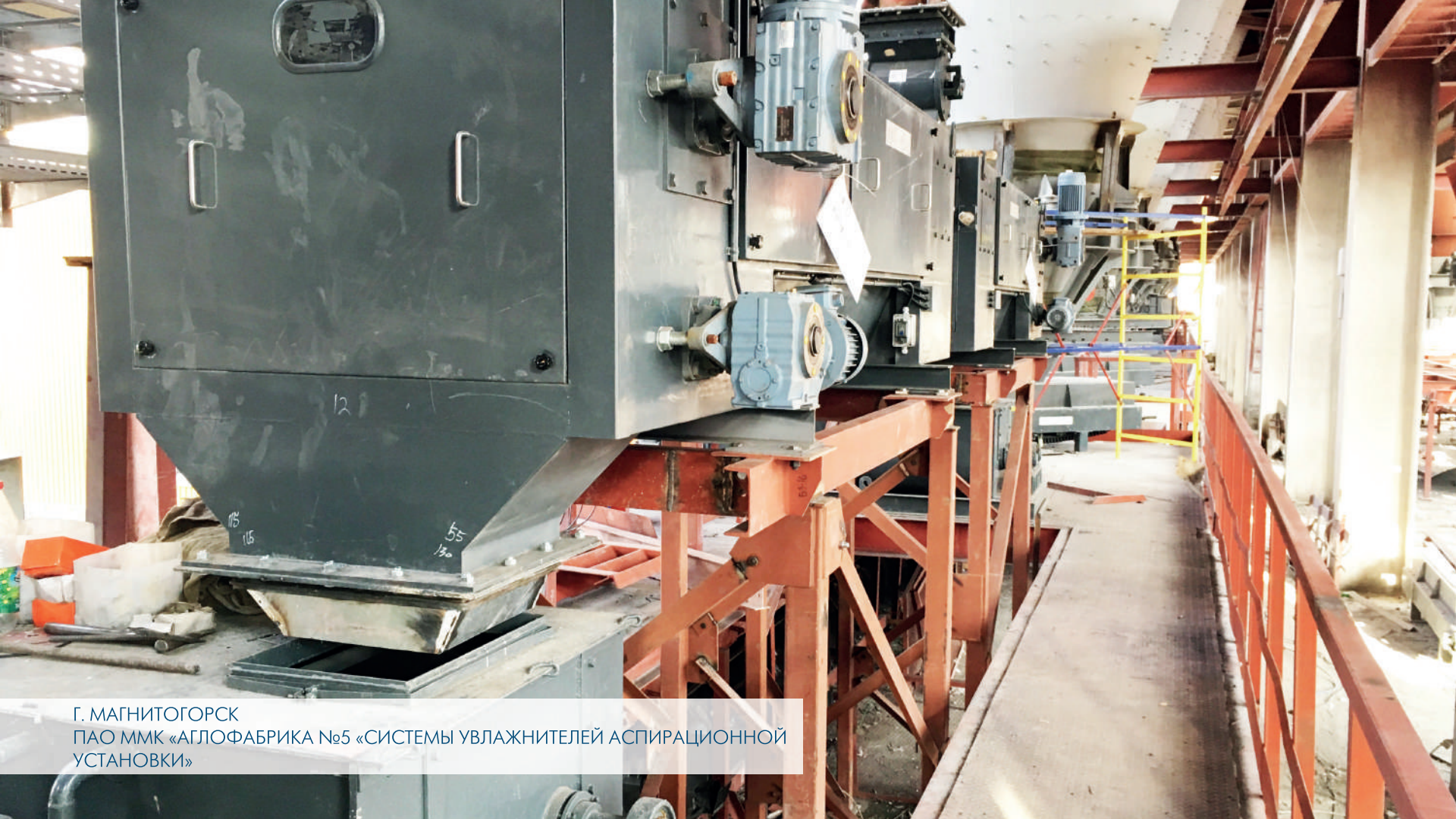
Г. МАГНИТОГОРСК ПАО ММК «АГЛОФАБРИКА №5 «СИСТЕМЫ УВЛАЖНИТЕЛЕЙ АСПИРАЦИОННОЙ УСТАНОВКИ»