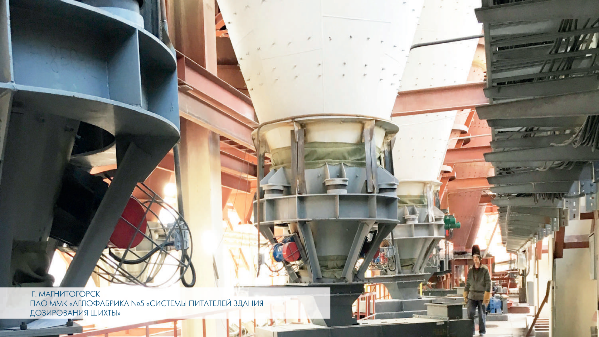
Г. МАГНИТОГОРСК ПАО ММК «АГЛОФАБРИКА №5 «СИСТЕМЫ ПИТАТЕЛЕЙ ЗДАНИЯ ДОЗИРОВАНИЯ ШИХТЫ»