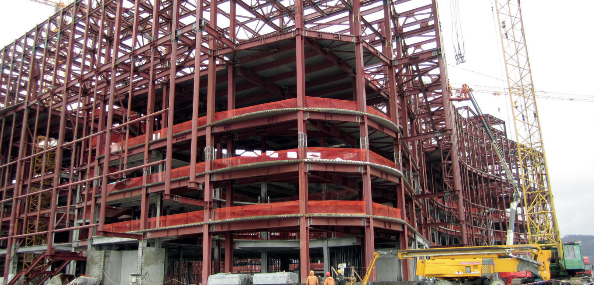
Г. АДЛЕР ДВОРЕЦ СПОРТА «АЙСБЕРГ»