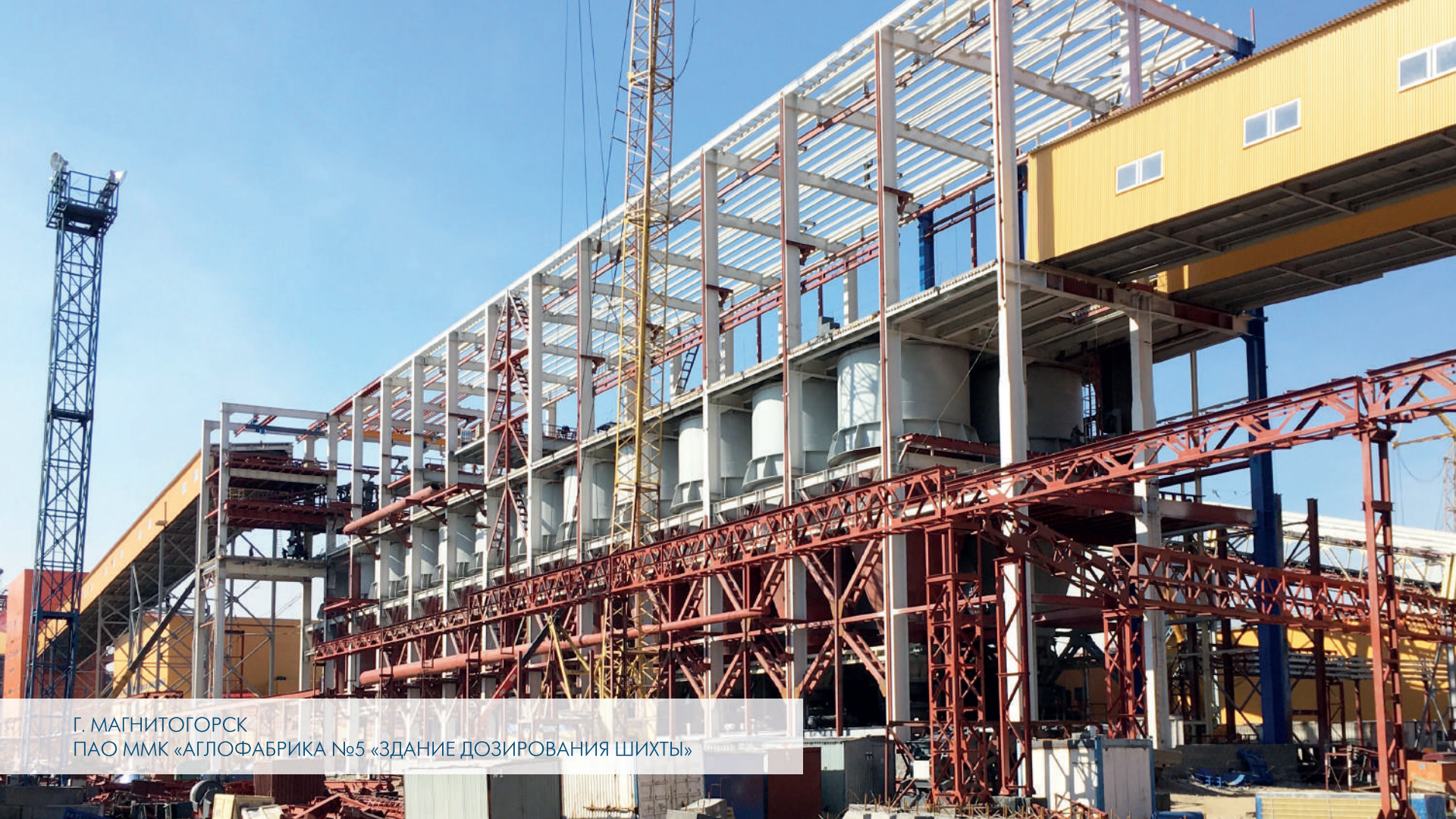
Г. МАГНИТОГОРСК ПАО ММК «АГЛОФАБРИКА №5 «ЗДАНИЕ ДОЗИРОВАНИЯ ШИХТЫ»