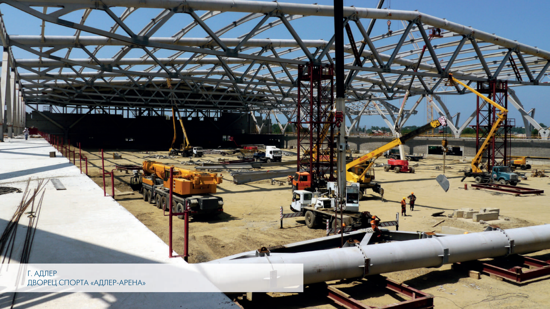
Г. АДЛЕР ДВОРЕЦ СПОРТА «АДЛЕР-АРЕНА»